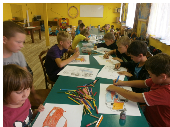
malování dopravních prostředků