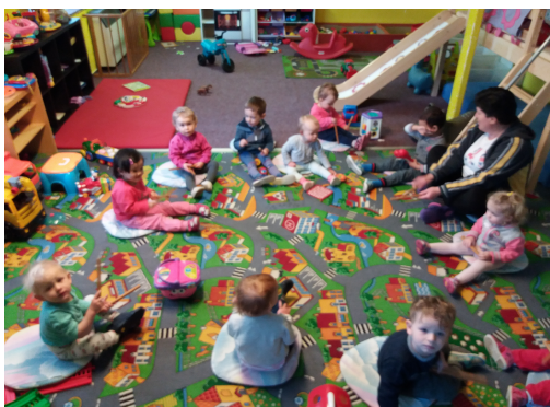
děti při zpívání

Platba za hlídání pokrývá náklady na mzdy zaměstnanců (kteří jsou částečně dotováni i za podpory Úřadu Práce), energie a doplácí se náklady na pořádané akce.