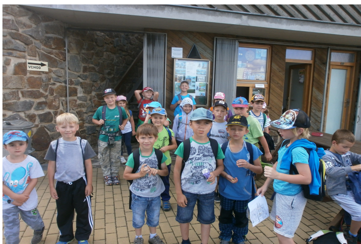
výlet na rozhlednu ve Velké Bukové a pěšky do Pustovět