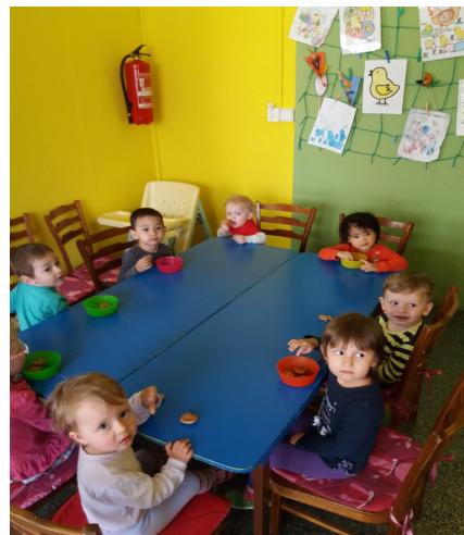
děti při svačince