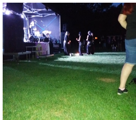
kapela Rock Slaves na pódiu a tanečnice Belidance pod pódiem