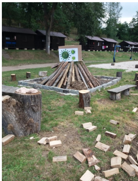
pálení CORONA viru

Poděkování: Město Rakovník Tyršovo koupaliště Fret Dupej-zvuk, pódium rodina, přátelé, dobrovolníci Středočeský kraj manželé Jaškovi Rock Slaves ostatní sponzoři