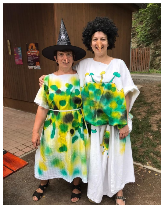
u vstupu byli 2 Corona Čarodějnice