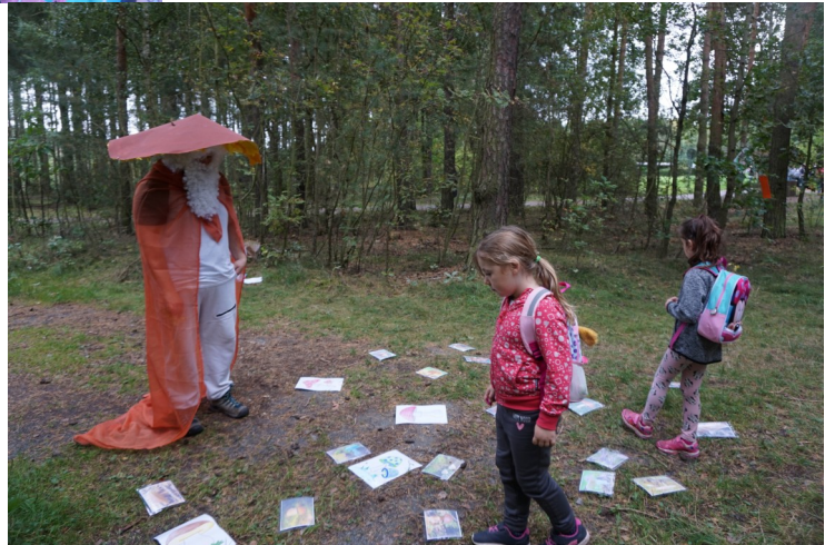
Houbový skřítek Hříbáč – hledání jedlích hub