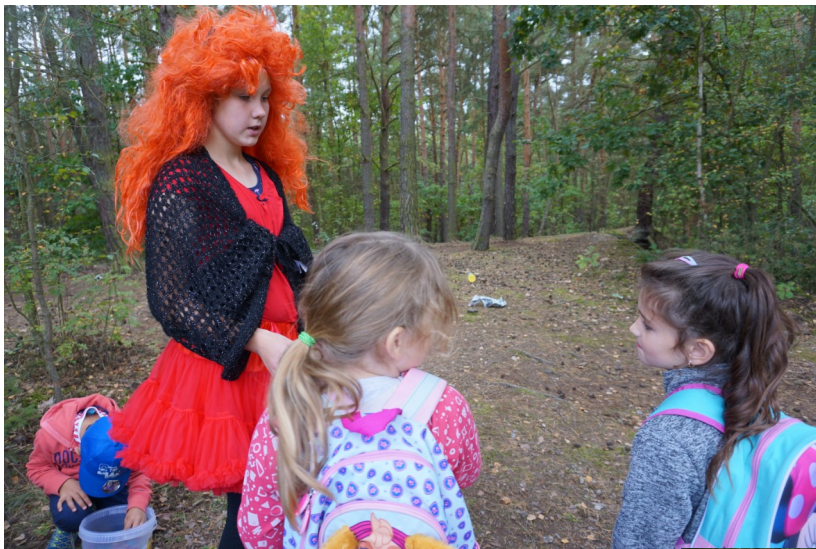
Satorejka domácí – uklízení odpadků