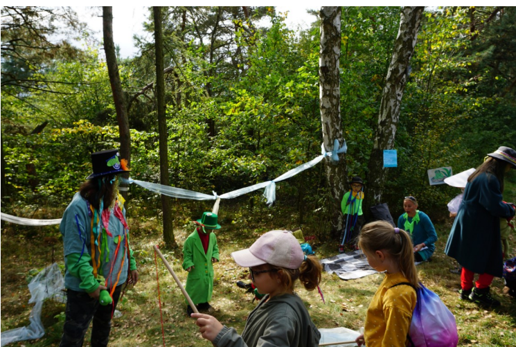
Vodník Skřehotaví – chytání rybek