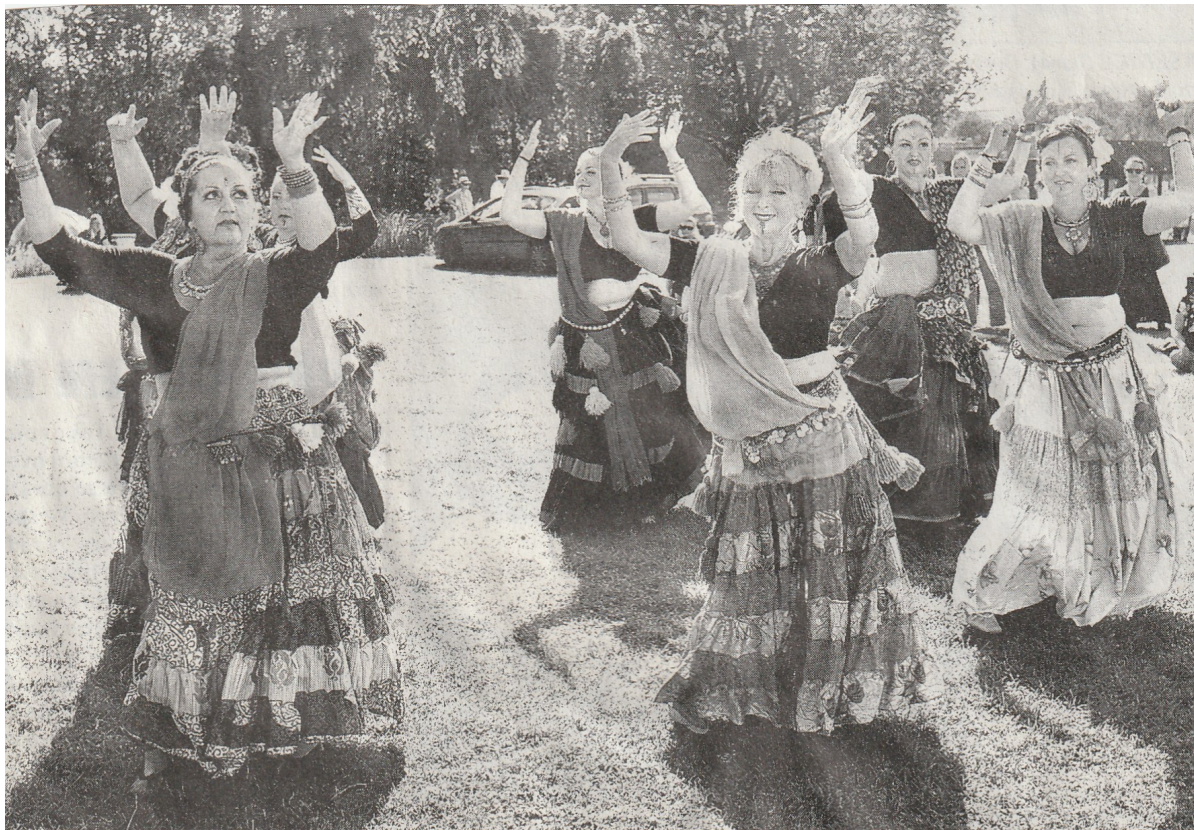
RAKOVNÍK. Sobotní Corona rej na Tyršově koupališti v Rakovníku splnil svůj účel. Pořádající Mateřské centrum Drak z Rakovníku vybralo na dobrovolném vstupném částku 9999 korun, která poputuje na podporu Zdravotních klaunů. Akci navštívilo 1200 dětí a dospělých. V rámci programu vystoupily i orientální tanečnice z Rakovníka (na snímku). Více na str. 2