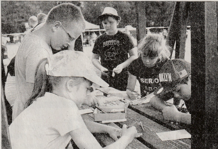
Coronarej – jedna z akcí centra Drak. Uprostřed srpna přitáhla na Tyršovo koupaliště dělnou řádku malých i velkých návštěvníků