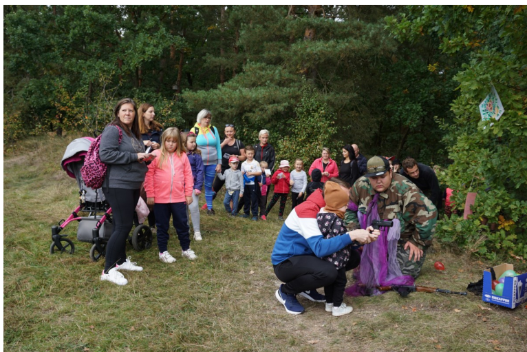
Borůvinka-střelba z airsoftové pistole