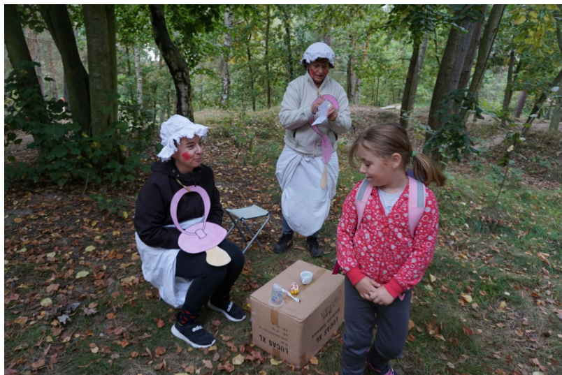
Skřítek Chůvička – Kimova hra